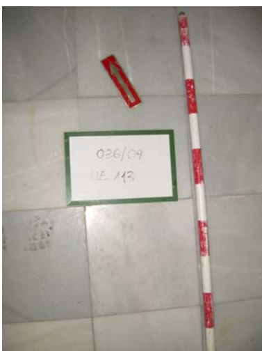
10. UE 113