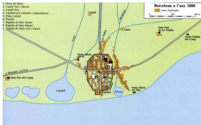
Topografia de Barcelona a l'any 1000 segons Philipp Banks

que correspondrien amb els actuals carrers de l'Hospital, Tallers i Sant Pau. Poc a poc s'anà formant la trama urbana entorn a aquestes tres vies.