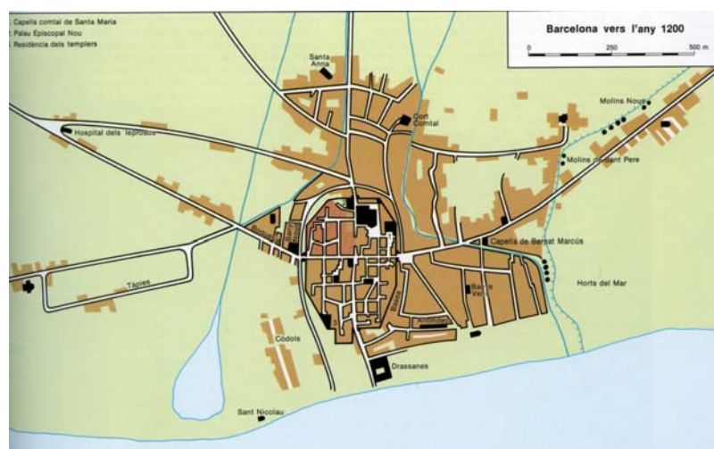
Barcelona a l'any 1200 amb la riera i l'estany de Cagalell

Durant l'Alta Edat Mitjana es documenta un primer nucli important al Raval (segons les tombes descobertes durant les obres del Pla Central del Raval) format per una petita vil·la bastida als voltants del monestir de Sant Pau del Camp. També comença a desenvolupar-se l'àrea entorn del Pedró, entre els carrer del Carme i Hospital i on posteriorment es fundaria Sant Llàtzer, per atendre els malalts de lepra, entorn els anys 1144 i 1171.