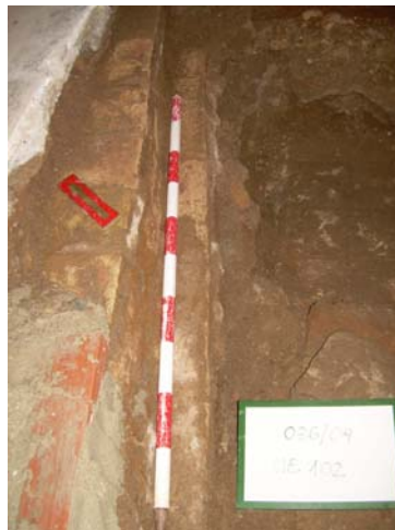
2. UE 102