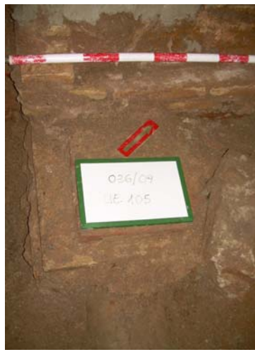
5. UE 105