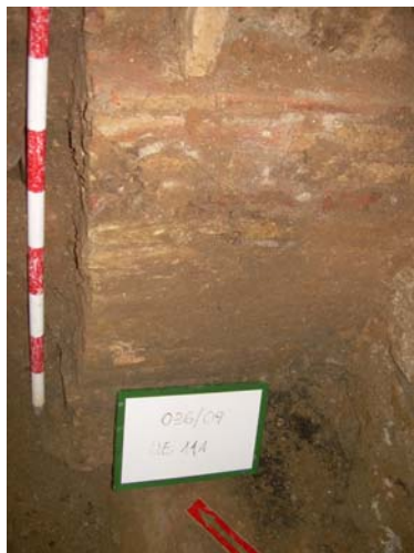
8. UE 111