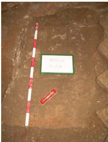
7. UE 107