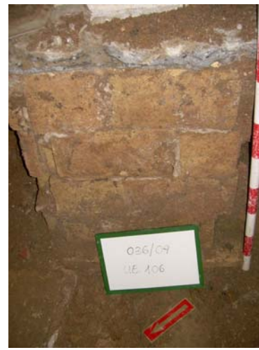
6. UE 106