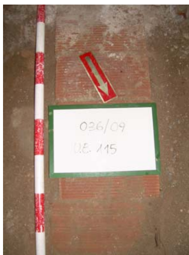
11. UE 115