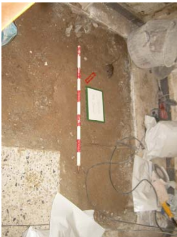
1. Fotografia inicial