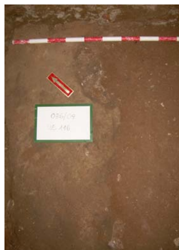
12. UE 116