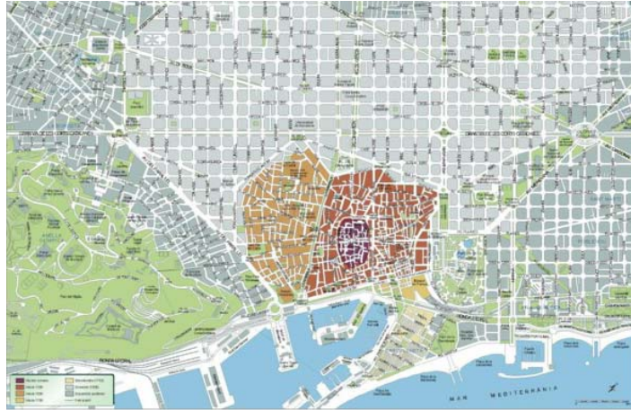
Vista de la ciutat de Barcelona amb indicació del districte de Ciutat Vella, on es localitza la zona d'intervenció.

La present intervenció s'ha realitzat al subsòl de la finca núm. 4 del carrer de la LLuna (fitxa cadastral:0150760-001) situada al Districte de Ciutat Vella de Barcelona.