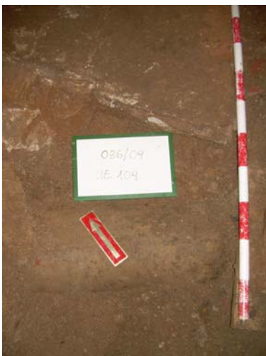
4. UE 104