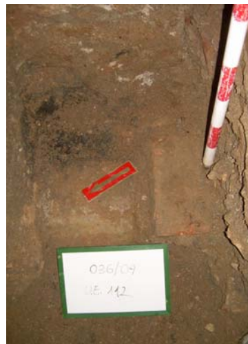
9. UE 112