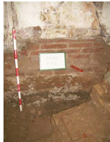
3. UE 103